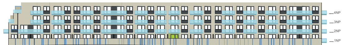
Jižní pohled na dům / Building View - south side